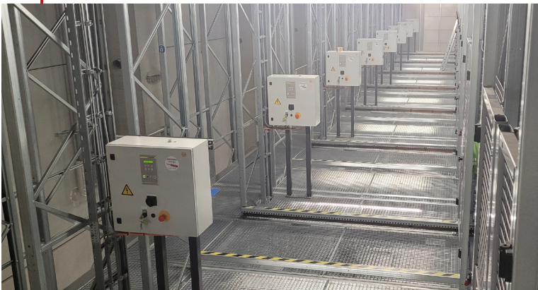
Durch die AMFE gesicherte Bereiche der Liebherr-Logistics GmbH